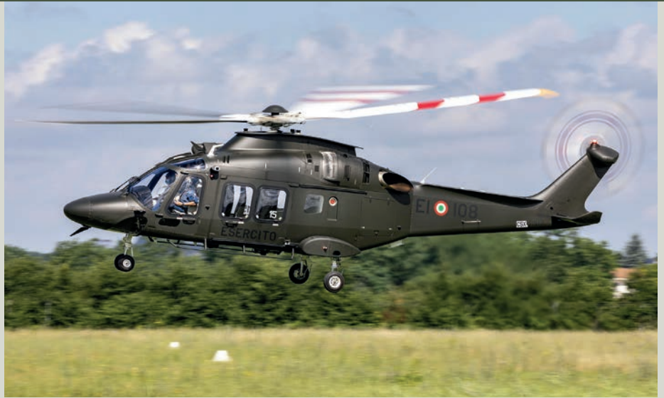
Neues Gerät geplant Das Heer wird in den kommenden Jahren zahlreiche neue Fahrzeuge und Fluggeräte beschaffen. Heuer soll der erste neue Leonardo-AW169-Hubschrauber als Nachfolger der Alouette III zulaufen.

Ausgehend vom aktuellen Budget von rund 2,7 Milliarden Euro werden im kommenden Jahr bereits 3,3 Milliarden Euro (plus 680 Millionen Euro) in das Bundesheer investiert. Bis