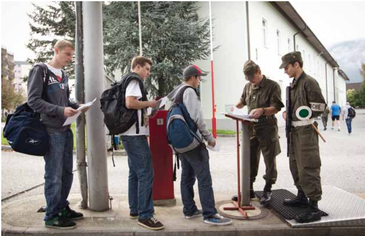
Die Stellung ist für die meisten Wehrpflichtigen einer der wichtigsten Erstkontakte mit dem Bundesheer.