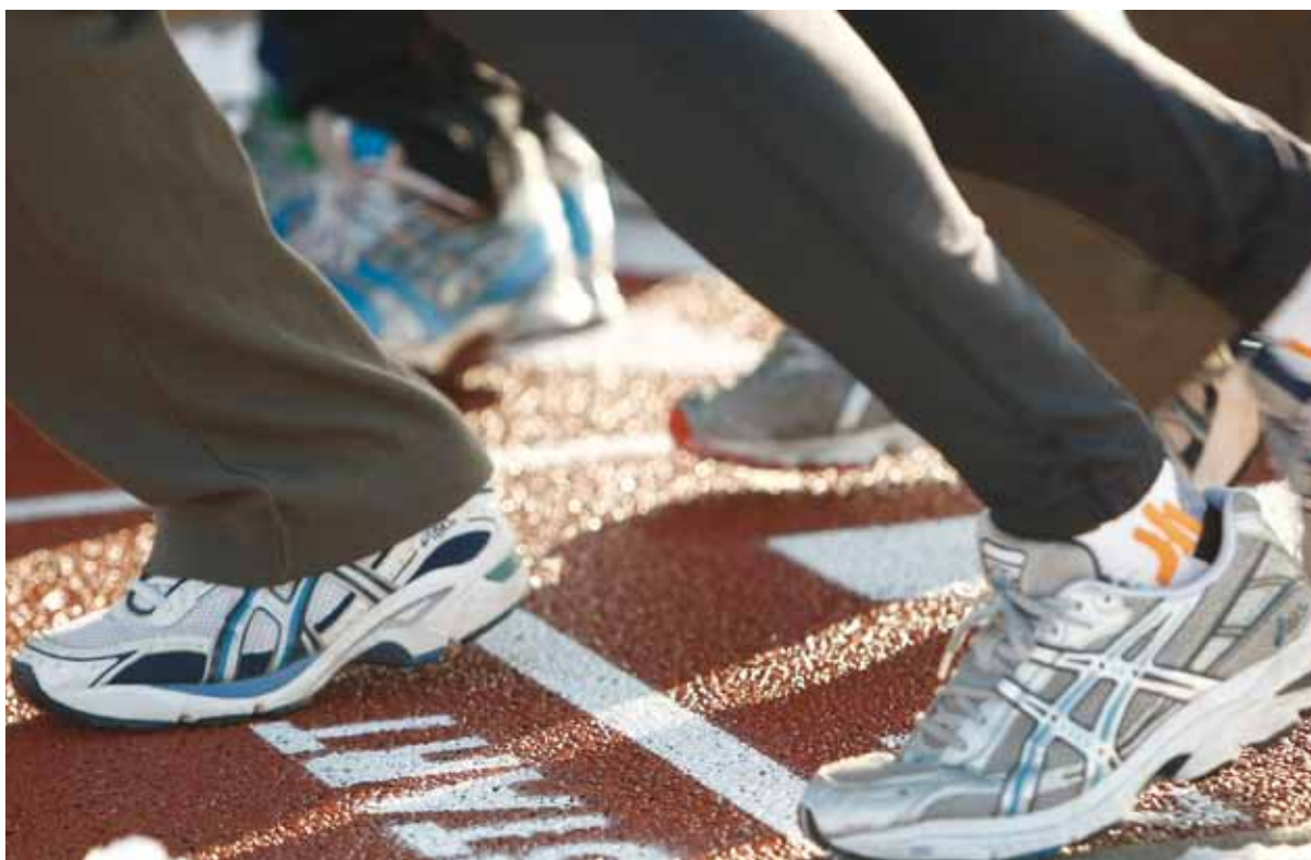
Sport beim Heer wird als nachhaltiger Beitrag zur Gesundheitsförderung forciert.

die Verbesserung und Erhaltung der körperlichen und geistigen Leistungsfähigkeit sowie um eine diesbezüglich förderliche Ernährung.