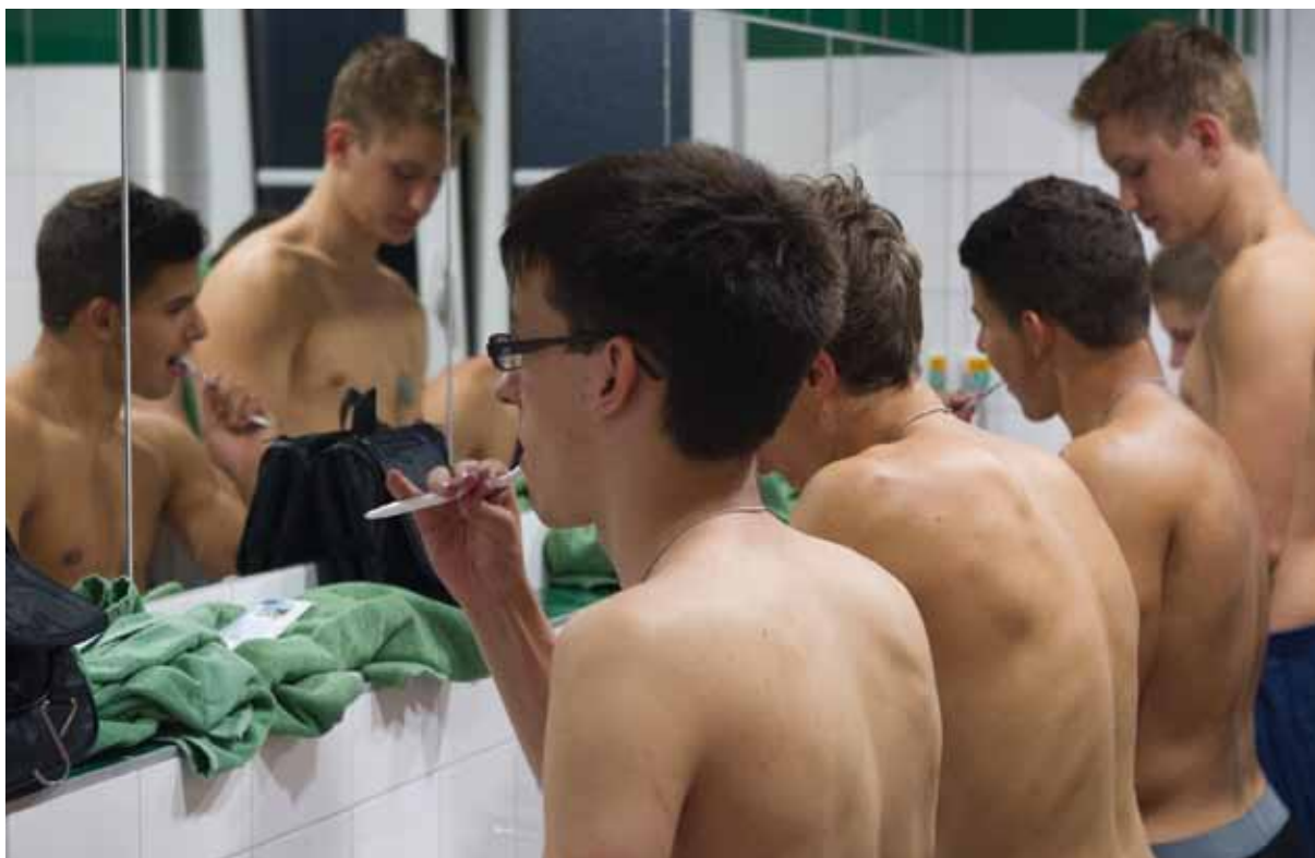
Ansprechende Sanitärräume gehören zu den zeitgemäßen Standards in der Unterbringung.