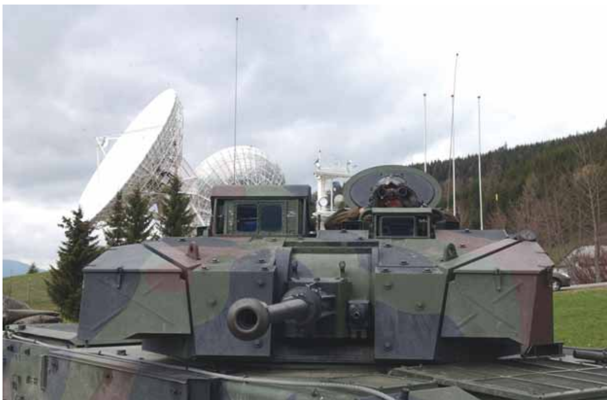
Der Schutz kritischer Infrastrukturen zählt zu den sicherheitspolizeilichen Assistenzaufgaben des Bundesheeres.