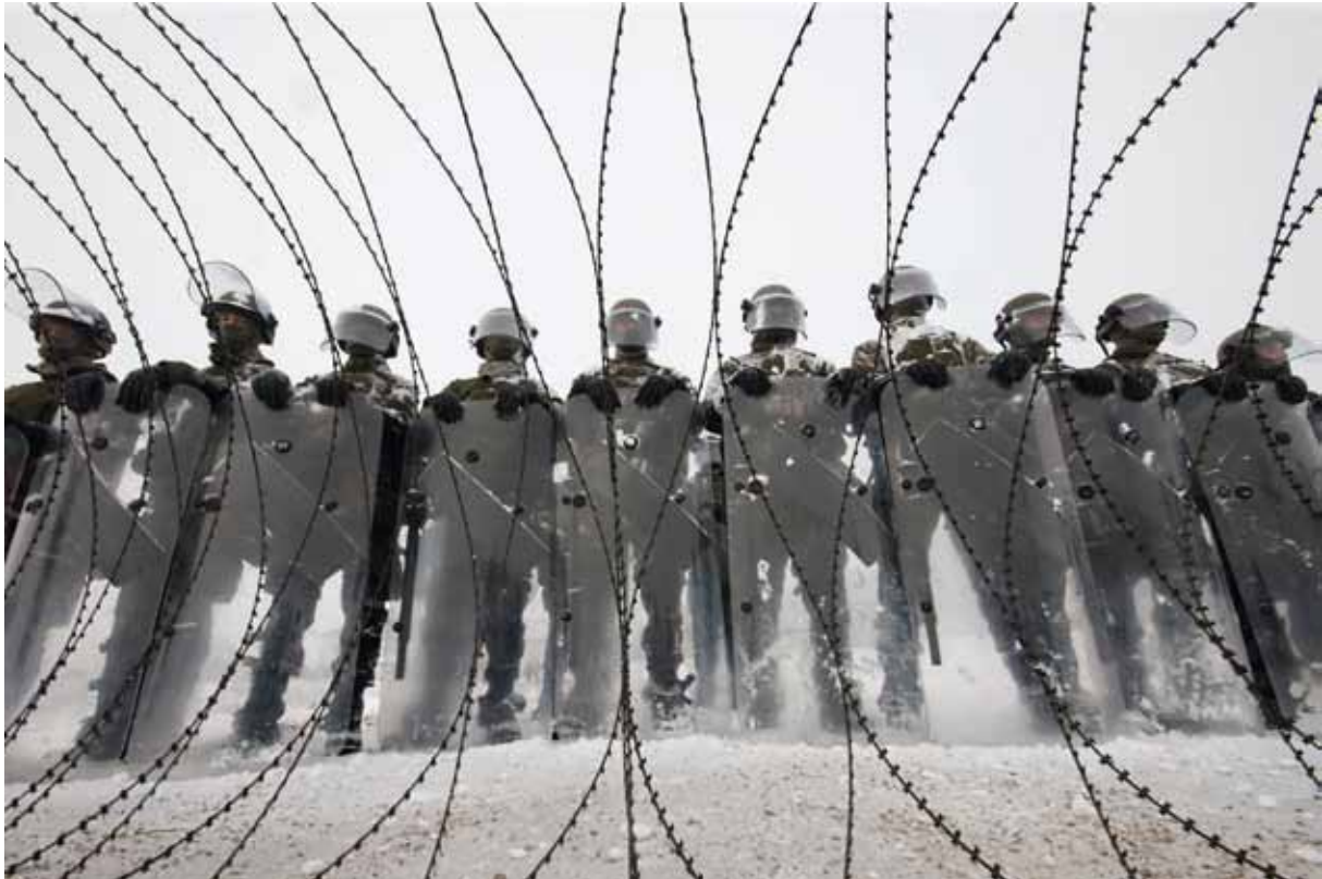
Bei Bedarf werden die Sicherheitsbehörden auch zur Aufrechterhaltung der öffentlichen Ordnung und Sicherheit durch das Bundesheer unterstützt.

mit einem konkreten Zweck, charakterisiert. Dies können Ereignisse sein, die sich über mehrere Tage erstrecken (vergleichbar mit der Fußball Europameisterschaft 2008 oder dem World Economic Forum), Besuche von bedeutenden Personen (Staatspräsidenten etc.), Transittransporte oder ähnliches. Auch in Zukunft kann bei derartigen Anlässen der Einsatz des Bundesheeres notwendig werden.