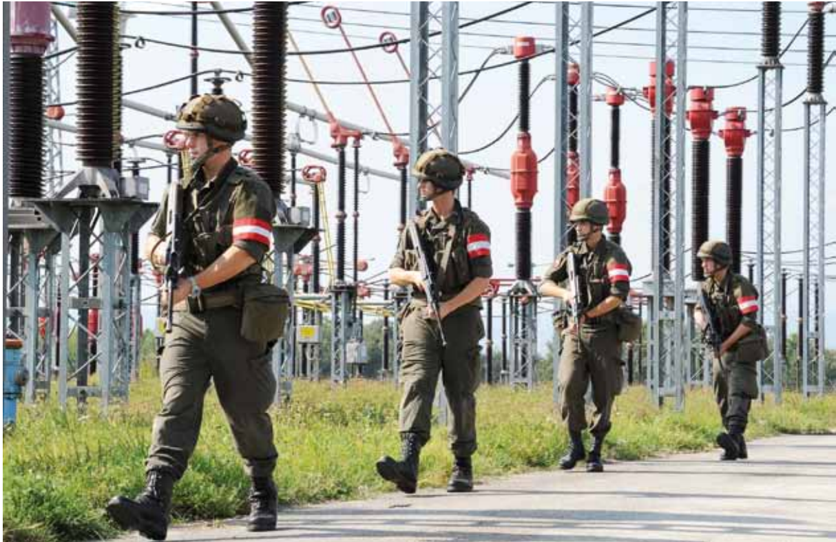
Von 1990 bis 2007 leisteten rund 200 000 Grundwehrdiener einen essenziellen Beitrag zur inneren Sicherheit Österreichs.

Bei höherer Intensität der Bedrohung kommen weitere Einsatzarten zur Anwendung (z. B. Verteidigung, Angriff, Verfolgung, ...), für welche die Rekruten nur nach erfolgter Ausbildung und somit erst am Ende des Grundwehrdienstes die notwendige grundlegende Qualifikation erreichen.